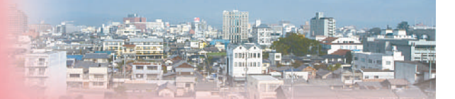
<展望浴場からの眺望>