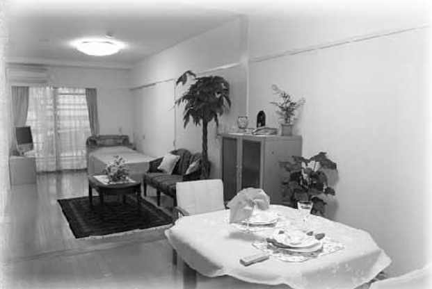
Aタイプ(居室の一例)

●緊急コール各戸(4ヶ所) ○トイレ(自動開閉・自動洗浄)○冷暖房完備○バスまたはシャワー○洗面所○ミニキッチン○洗濯パン