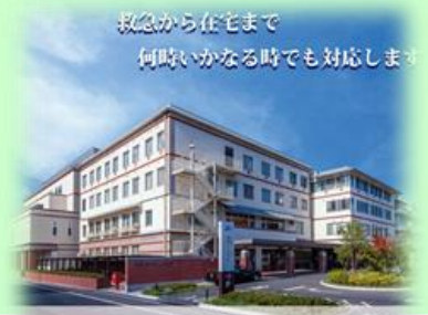
倉敷平成病院は 34 周年を迎えました

☆☆倉敷平成病院増改築工事完工しました☆☆ 令和3年8月、ローズガーデン倉敷の母体、倉敷平成病院の増改築工事が終わり、とてもきれいに新しく生まれ変わりました！ 倉敷平成病院へは、平日の午前中、職員による無料送迎を行っています。皆様、是非ご利用下さい。