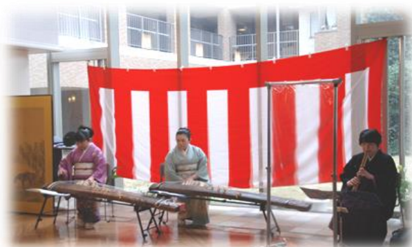
《令和4年1月 新年箏曲演奏会 無観客にて開催》