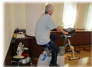
《エアロバイク 1日20分》