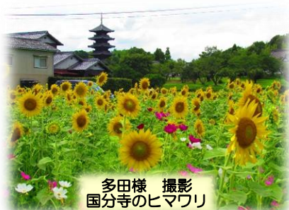
国分寺のヒマワリ

入居した当時と比べると、周囲の景色もずいぶん変わりました。目の前にはグランドガーデン南町が開設され、春になるとローズガーデン倉敷の前の道には見事な桜が咲きます。シンボルツリーの楠木が少しずつ大きくなっていく姿にも、時の流れを感じています。ここでの暮らしの中で、たくさんの気の合う友人に恵まれました。カラオケ、写真、民謡と、好きなことを分かち合える仲間がいることは、本当に幸せなことだと感じています。