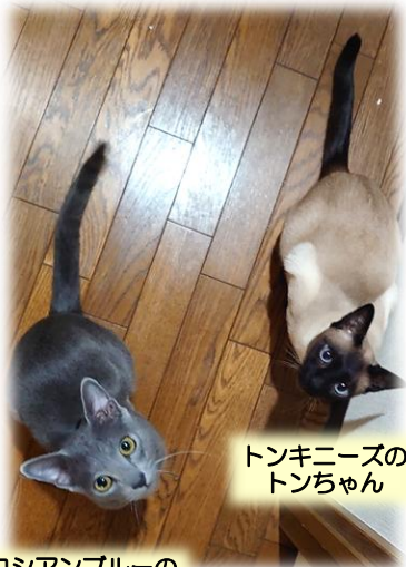
ロシアンブルーの ブルーちゃん