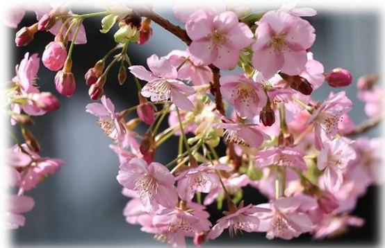
《中庭の河津桜 R8.3.7 撮影》

本年度も、皆さまお一人おひとりの歩みに寄り添いながら、より質の高いサービスの提供に努めてまいります。